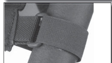
Fig 4 Bande velcro attachée