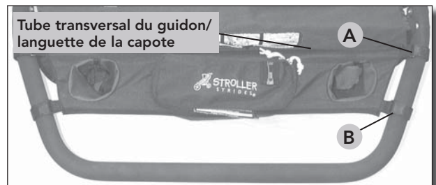
Fig 1 Orientation du kit cardio-poussette