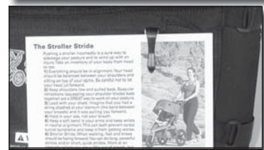
Fig 5 Pince pour guide d'exercices