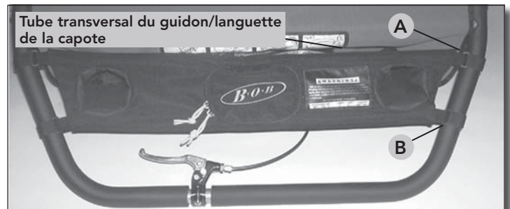
Fig 1 Orientation de la console