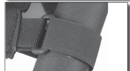
Fig 4 Bande velcro attachée