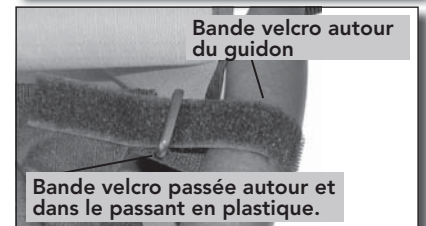
Fig 3 Passage de la bande velcro